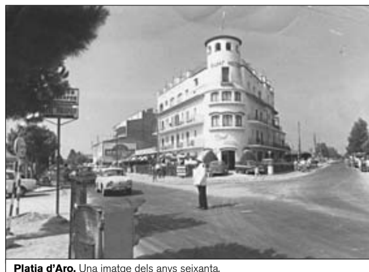
Platja d'Aro. Una imatge dels anys seixanta.

Però amb l'esclat del fenomen turístic la vila havia d'acomplir unes noves necessitats i part dels ciuta-