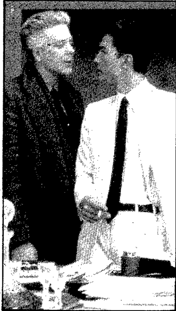
Un fotogramà de «Manhattan Sur»

Però això és només història, fets que tothom té una natural tendència a atribuir a la mala fe d'uns productors ignorants. Es tracta, per desgràcia, d'una creença equivocada, ja que el fenomen s'està repetint als nostres dies. Com bé pot donar fe Michael Cimino, el director de «El cazador», que compta amb una llista massa llarga de films tallats. A «Las puertas del cielo» les reduccions que patí varen ésser memorables: els personatges apareixen com per art de màgia, les parelles se'n van al llit només de conèixer-se i les discussions acaben com el rosari de l'aurora. Tot i això va ésser molt agraït pel públic, que va demostrar l'eficà-