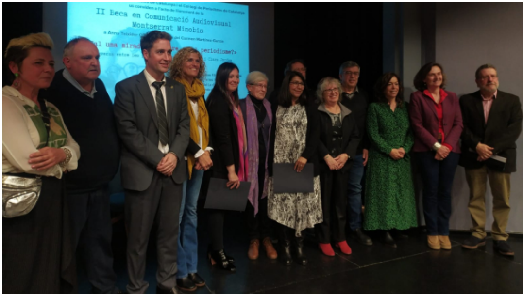
Els protagonistes de l'acte del lliurament de la II Beca Montserrat Minobis.

La UdG, a través de la Càtedra Hipòlit Nadal de Revistes en Català , s'ha incorporat a l'organització de la Beca Minobis.