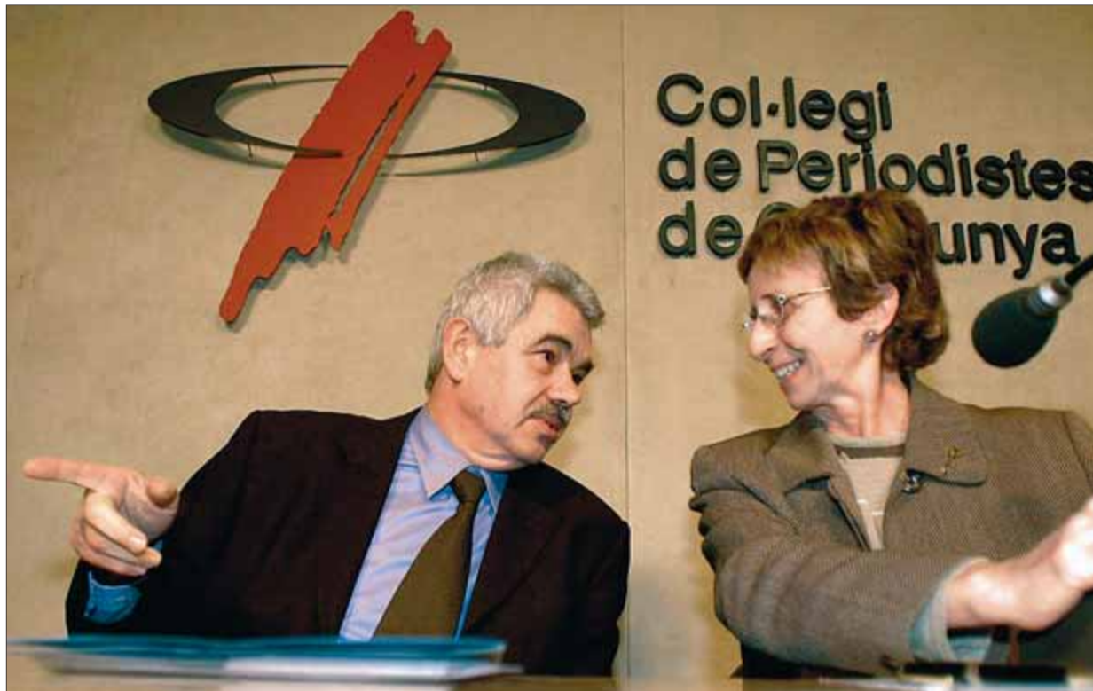
Pasqual Maragall al Col·legi de Periodistes l'any 2002 amb l'aleshores degana Montserrat Minobis