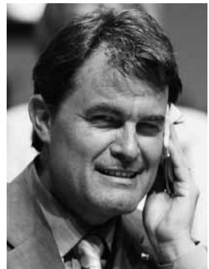
Artur Mas, en el congreso de CDC

prologar. Mas ha escogido otra fórmula para hacer visible su apoyo a Kerry con la confianza de que esta vez sí que juegue a caballo ganador. El entorno de Mas, que bebe de la escuela del Partido Demócrata, ha creído ver similitudes entre él y el candidato estadounidense. Como Kerry, Mas no quiere desgastarse