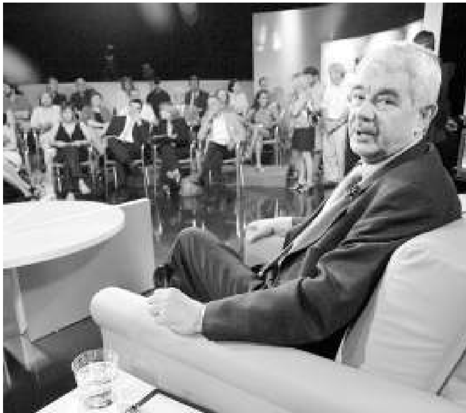
Maragall, durant la pausa publicitària al plató de TV3 amb el públic al fons.

De les 22 persones que componien ahir el públic del programa, nou van poder interpel·lar el President. Les persones escollides per conversar amb