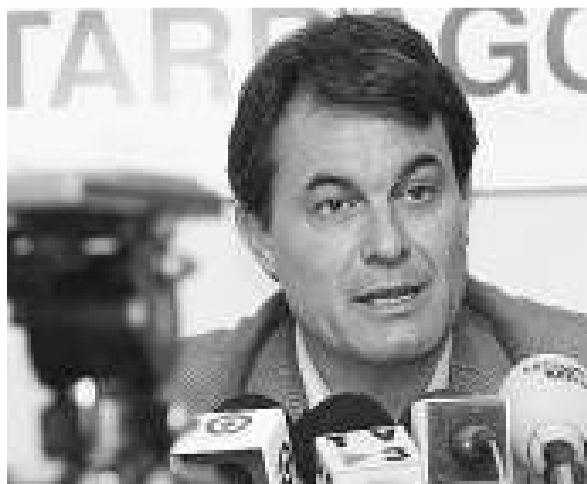
En el camp del catalanisme s'acaba l'època de les mitges tintes. Com més temps tardi Mas a adonar-se'n, més vots anirà perdent.

S i algú necessitava una prova més per entendre les raons per les quals ERC ha guanyat vots en el darrer cicle electoral i CiU n'ha perdut, la té en les posicions que han pres davant del referèndum sobre la Constitució europea les dues formacions que es disputen el vot catalanista. ERC defensa el vot contrari a la Constitució i, per boca del seu president, Carod-Rovira, ha dit frases tan clares com aquesta: «Si una Constitució diu 'no' a Catalunya, nosaltres només podem respondre amb un altre 'no'.» És un raonament diàfan, contundent i que tothom entén, encara que a alguns els pugui molestar per la seva intensa negativitat. Però a Catalunya, la consciència del fet que ens estan prenent el pèl i els diners amb el finançament, amb els peatges i amb tantes coses provoca un empenyament que va augmentant i que ja no està per gaires formalitats. Al costat d'això és curiós veure el que ha passat a CiU. A CDC, per més sobiranisme que hi hagi entre el jovent i les bases,