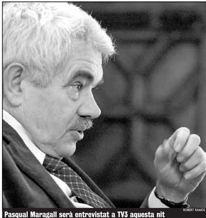
Pasqual Maragall serà entrevistat a TV3 aquesta nit

Davant aquesta proposta, que es farà efectiva aquesta nit a TV3, el secretari general de CDC, Artur Mas, va carregar ahir amb duresa contra l'ús partidista que, segons ell, fa el PSC de la graella de TVC i va acusar-lo de segrestar la televisió pública per convertir-la en "TV Maragall", segons informa Oriol Margalef.