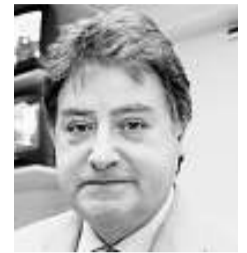
FRANCESC CODINA PRESIDENT DEL CAC

Deixa el càrrec després de 5 anys de mandat