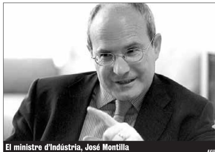
El ministre d'Indústria, José Montilla

El quart canal de televisió privada analògica que treu a concurs el govern central tindrà una cobertura del 70% de la població de l'Estat i deixarà d'emetre el 3 d'abril de 2010, d'acord amb l'apagada analògica prevista en el reial decret del pla tècnic de la TDT aprovat ahir. El plec de bases admi-