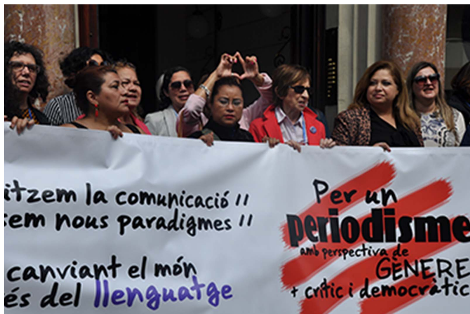
Concentració del Col·legi de Periodistes de Catalunya

Escrito por Drina Ergueta. La Independent Jueves, 21 de Abril de 2016 18:49