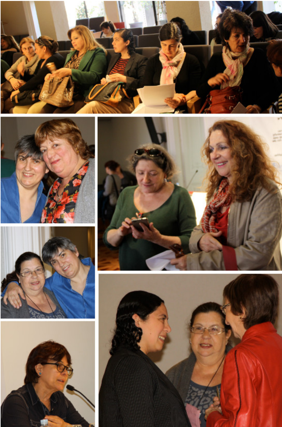
Salón de Actos del Colegio de Periodistas de Catalunya, Barcelona Por Barcelona, 15 de abril de 2016

Antes del acto de inauguración, las participantes del VI Encuentro Internacional de la Red Internacional de Periodistas con Visión de Género (RIPVG) , han llevado a cabo, delante del Colegio de Periodistas de Catalunya , una Concentración reivindicativa bajo el lema ‘Por un periodismo donde las mujeres sean protagonistas, como expertas, líderes, representantes sociales y políticas’ .